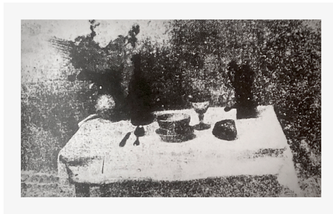
Nicéphore Niépce – “La mesa puesta”, 1822.

Esta historia veré de articularla no solamente a través de una poética de palabras y de números sino además, tratándose de la fotografía, de la magia anímica y razonable que desprenden unas imágenes dentro del texto y el contexto que se les confiere a la hora de contar una historia.